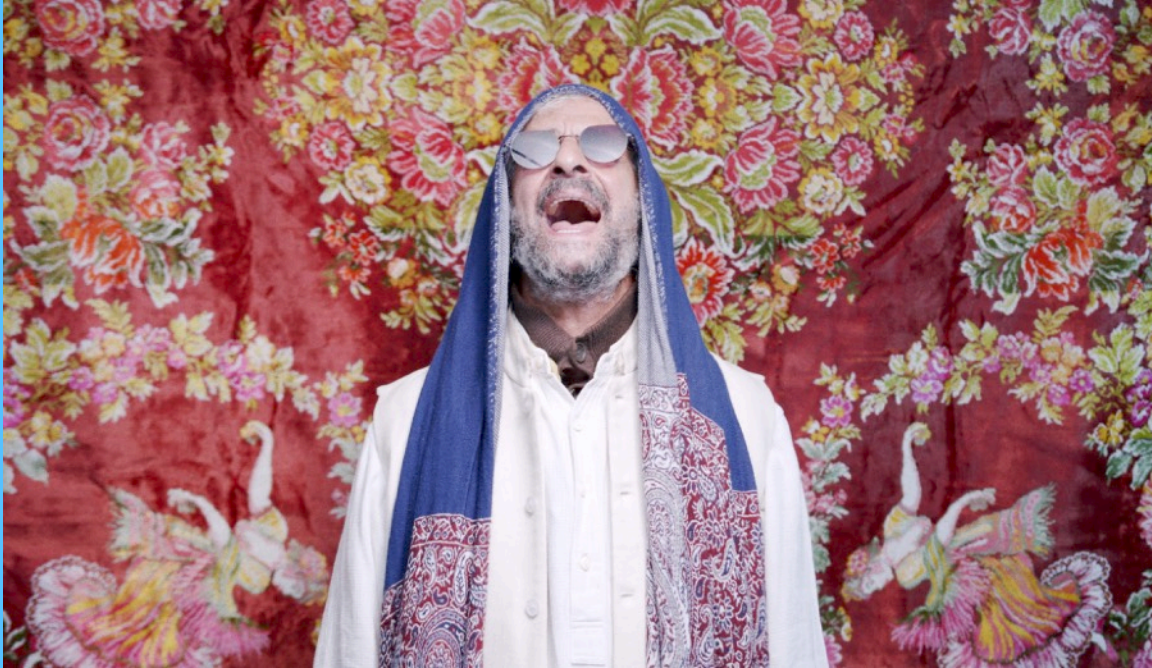
Extrait de 'Boxer avec Dieu'

Nouveau film musical du cinéaste et musicien AMIT HAÏ COHEN avec JOJO