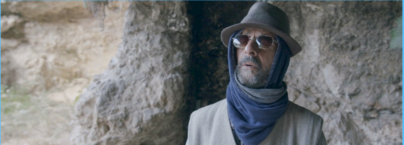
Extrait de 'Boxer avec Dieu'

Ce film, de trente minutes, est l'œuvre de la première collaboration entre Jojo et Cohen qui se sont connus dans le milieu marocain à Jérusalem. Lors de leur rencontre, ils découvrent alors qu'ils sont voisins et, depuis, ils ont tissé de forts liens d'amitié. Leur proximité géographique leur a permis de travailler au studio d'Amit pendant le confinement. La bande originale du film sortira prochainement.